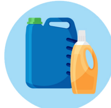
Javel / désinfectant Bleach / disinfectant