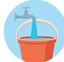
Eau et seau Water and pail