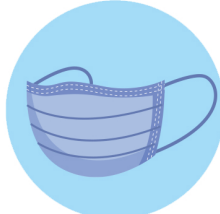
Masques de protection Protective mask