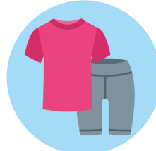
Change de vêtements Change of clothes