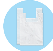
Sacs poubelle Plastic / trash bags