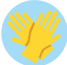
Gants jetables Disposable gloves